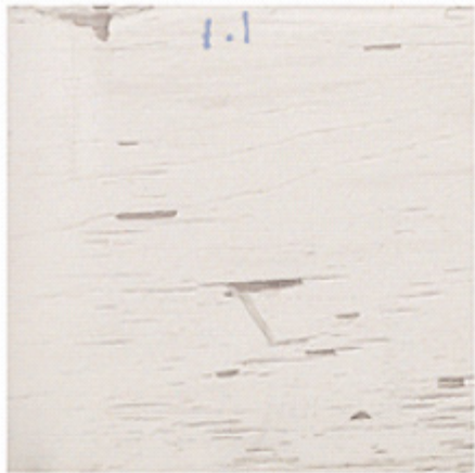
코팅 2회(프라이머 미사용)