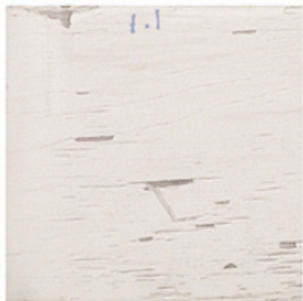
2 层 (无底漆)